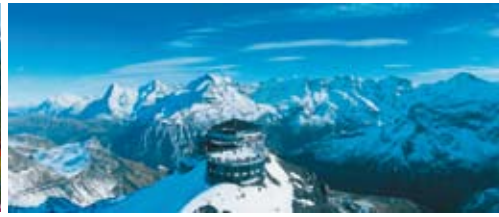
Schilthorn mit James Bond Drehrestaurant