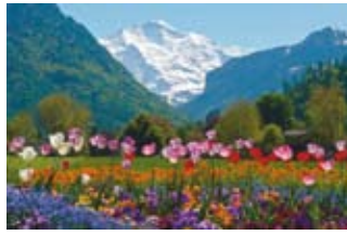
Interlaken im Frühling