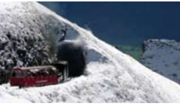
Brienz Rothorn Bahn im Schnee