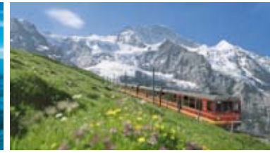
Jungfraubahn /Top of Europe