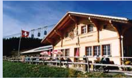
Bärgrestaurant Vorsass Telefon 033 841 00 28

Das Team der Thunersee-Beatenberg-Niederhorn Bahnen wünscht Ihnen eine tolle und erlebnisreiche Abfahrt von Vorsass nach Beatenberg.