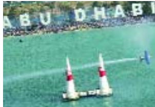
Start der Red Bull Air Race World Series in Abu Dhabi – am 15. Juli heisst es «Smoke on» in Interlaken.

«Luege, lose, brichte und gniessel!» Unter diesem Motto haben die drei Destinationen Grindelwald, Wengen Mürren Lauterbrunnental und Interlaken den Sommer in der Jungfrau Re-